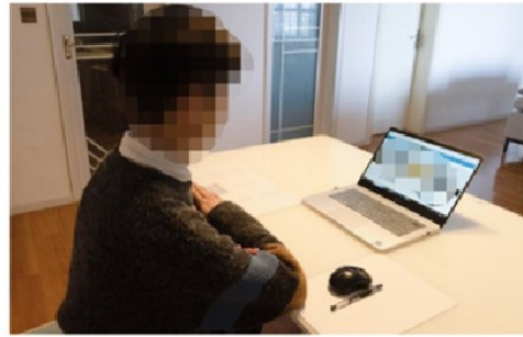
辅机位呈现的画面示意图