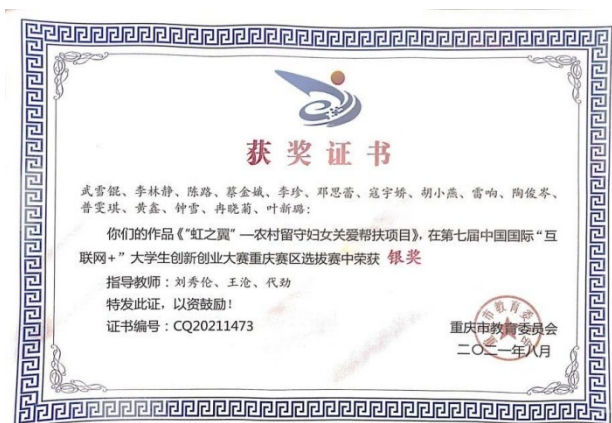
马克思主义学院研究生获得第七届中国国际“互联网+”大学生创新创业大赛重庆赛区选拔赛银奖

近五年来，我院研究生公开发表论文 185 篇，其中 CSSCI 期刊论文 21 篇；在“西南地区马克思主义理论学科研究生论坛”和“重庆市研究生马克思主义论坛”中我院研究生有 110 余人次获奖；近 20 名同学在第七届中国“互联网+”大学生创新创业大赛（重庆赛区）、重庆市高等学校“中华魂”（民族复兴的旗帜——纪念中国共产党建党 100 周年）主题征文等省部级竞赛中获奖；44 名同学获得重庆邮电大学“优秀共产党员”、“优秀共青团员”、“优秀研究生干部”等校级荣誉称号；5 名同学获得“国家奖学金”。