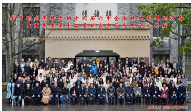
参加重庆市研究生马克思主义论坛