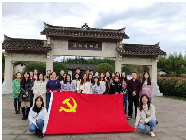
马克思主义学院研究生党支部开展“感受红色情怀、追忆革命精神”外出研学活动