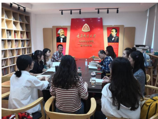
马克思主义学院研究生开展“读原著 品经典”系列读书活动