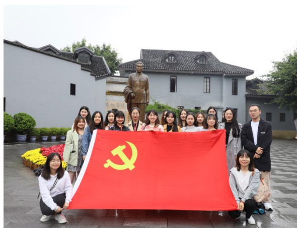
马克思主义学院研究生党支部赴重庆周公馆开展主题党日活动