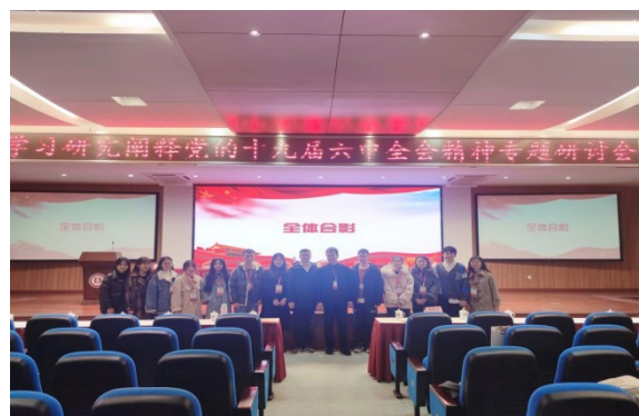
参加重庆市研究生马克思主义论坛